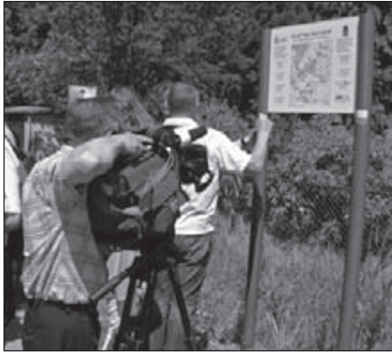
Ruime mediabelangstelling voor het pad