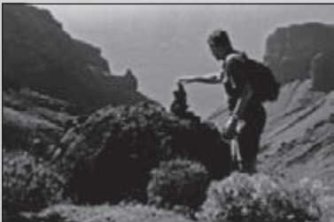
La Gomera mooi wandeleiland