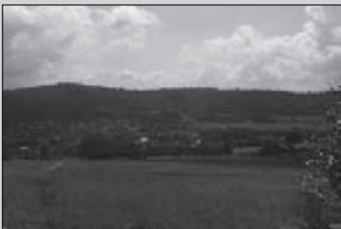
Rothaarsteig goed te doen