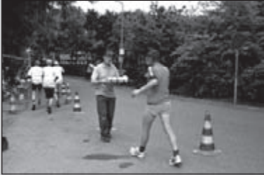
Weert: de uitslagen geanalyseerd

CLUBBLAD VAN WSV OLAT • JAARGANG 35 • NUMMER 7&8 • JULI-AUG 2009