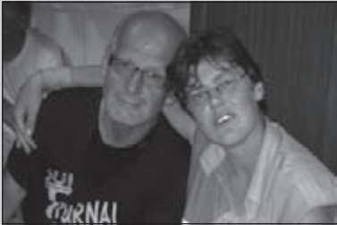
Samen sterk op Franse Audaxtocht