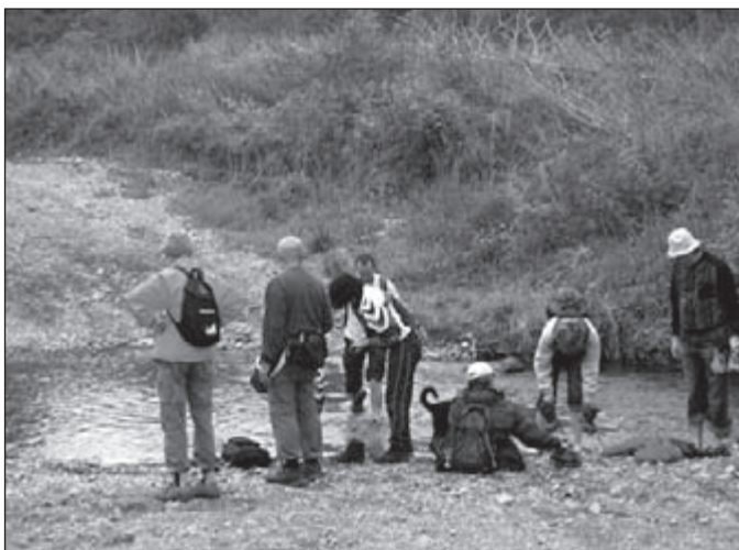
Op stap in de buurt van Vladivostok met o.a. leden van de plaatselijke wandelclub.

Van OLAT-leden die maar 1 of 2 dagen komen wandelen in Geldrop kunnen we om organisatorische redenen helaas geen lijstjes bijhouden.